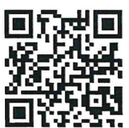
สรุปการประชุม ศบค. ครั้งที่ ๑๒/๒๕๖๕

หัวหน้าผู้รับผิดชอบในการแก้ไขสถานการณ์ฉุกเฉิน ในส่วนที่เกี่ยวกับการสั่งการและประสานกับผู้ว่าราชการจังหวัด และผู้ว่าราชการกรุงเทพมหานคร